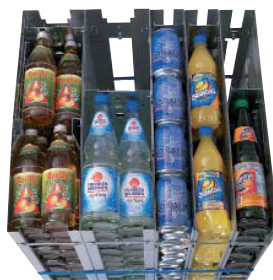
1-fach bis 4-fach Produktlagerung