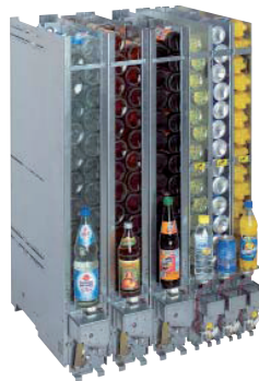
Normal- und Schmalschächte